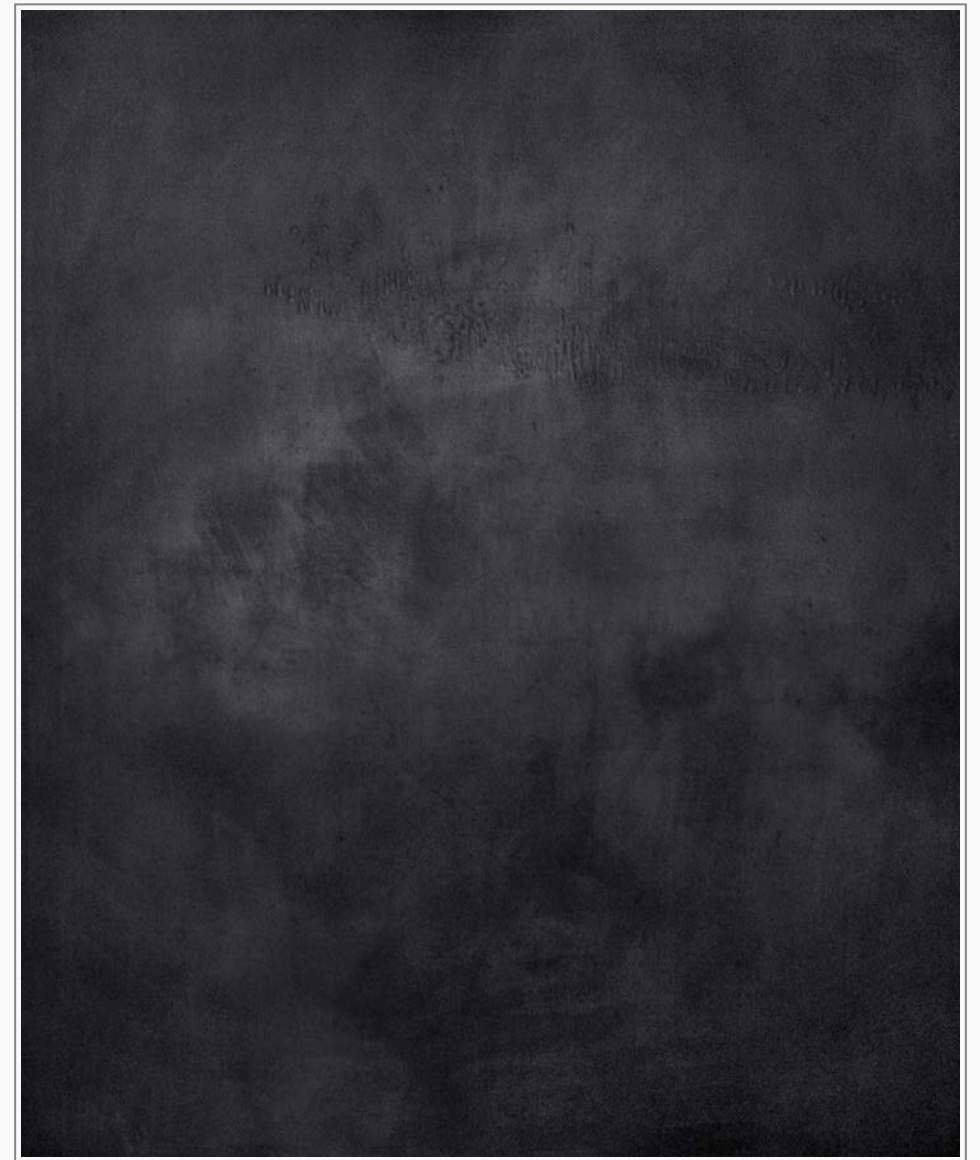
Grund 3 - Öl, Graphit auf Leinwand, 220 cm x 180 cm, 2016 Grund 3 - oil, graphite on canvas, 220 cm x 180 cm, 2016