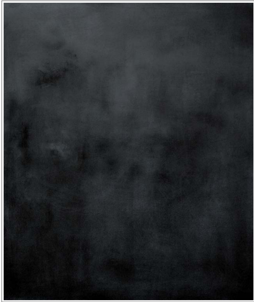
Grund 6 - Öl, Graphit auf Leinwand, 150 cm x 120 cm Grund 6 - oil, graphite on canvas, 150 cm x 120 cm