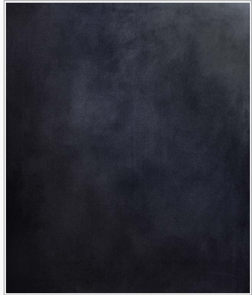
Grund 7 - Öl, Graphit auf Leinwand, 150 cm x 120 cm Grund 7 - oil, graphite on canvas, 150 cm x 120 cm