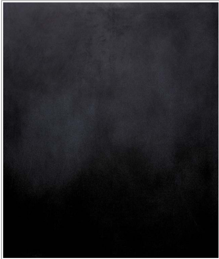
Grund 8 - Öl, Graphit auf Leinwand, 150 cm x 120 cm Grund 8 - oil, graphite on canvas, 150cm x 120 cm