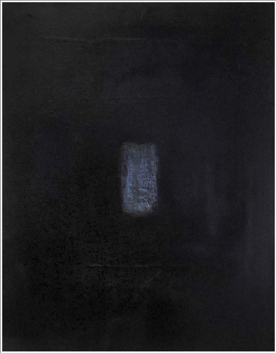
The Power to Believe - Öl, Graphit auf Holz, 63 cm x 49 cm The Power to Believe - oil, graphite on wood, 63 cm x 49 cm