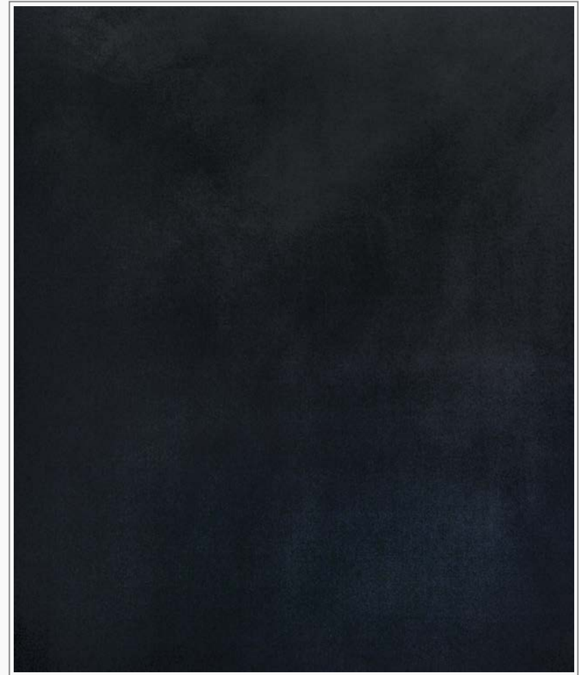
Grund 9 - Öl, Graphit auf Leinwand, 150 cm x 120 cm Grund 9 - oil, graphite on canvas, 150 cm x 120 cm