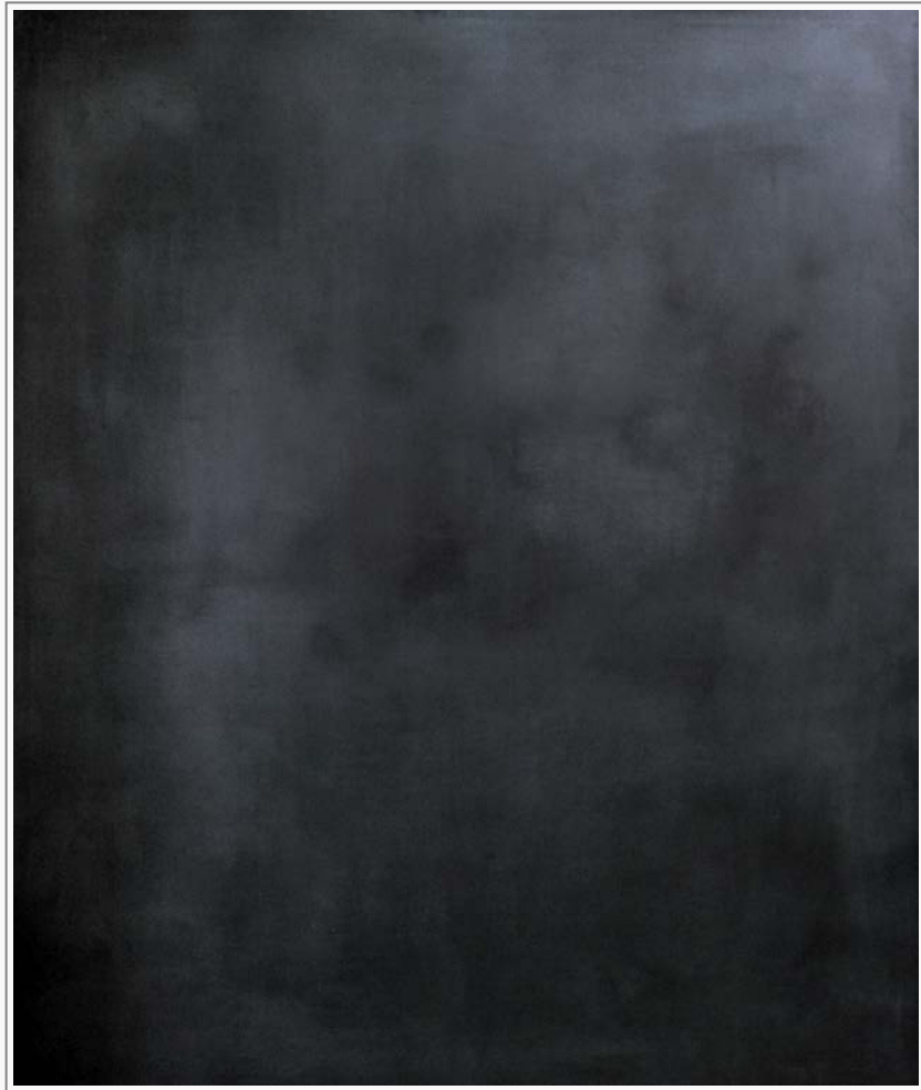
Grund 4 - Öl, Graphit auf Leinwand, 150 cm x 120 cm Grund 4 - oil, graphite on canvas, 150 cm x 120 cm