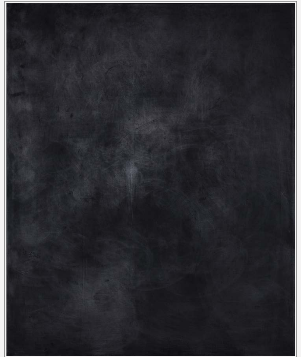
Grund 1 - Öl, Graphit auf Leinwand, 220 cm x 180 cm Grund 1 - oil, graphite on canvas, 220 cm x 180 cm