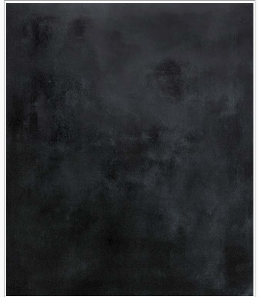
Grund 5 - Öl, Graphit auf Leinwand, 150 cm x 120 cm Grund 5 - oil, graphite on canvas, 150 cm x 120 cm